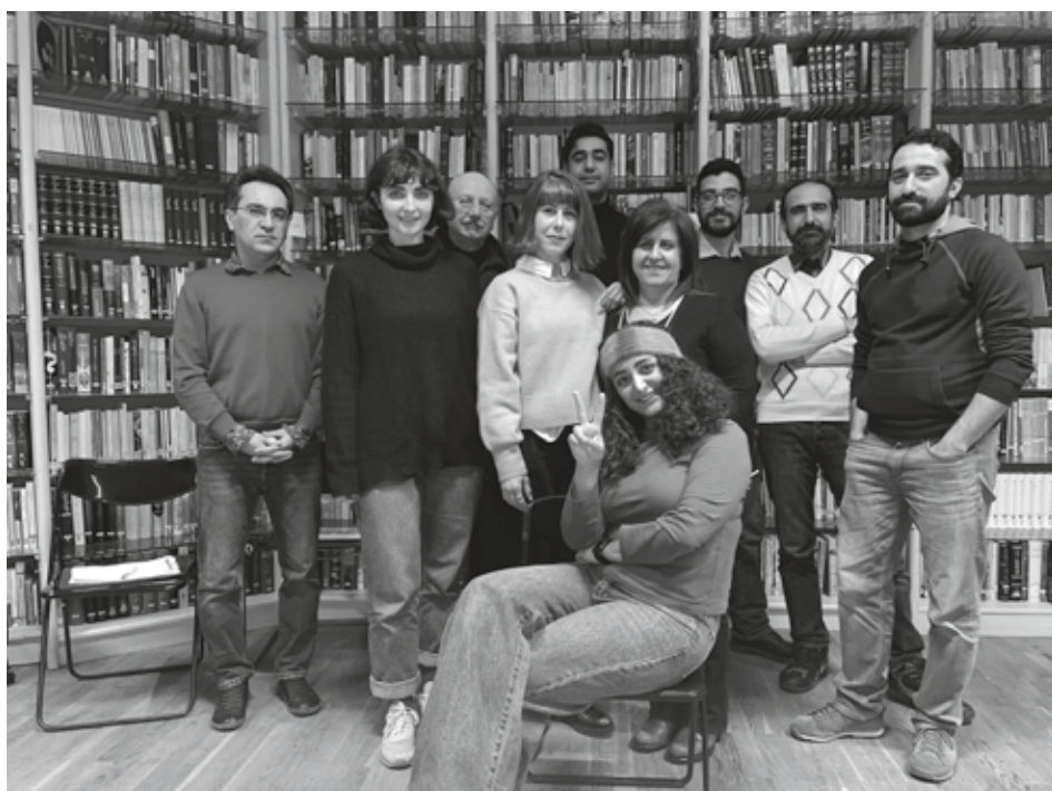
Organisationsgruppe für den Weltfrauentag am 8.März im iranischen Kulturhaus