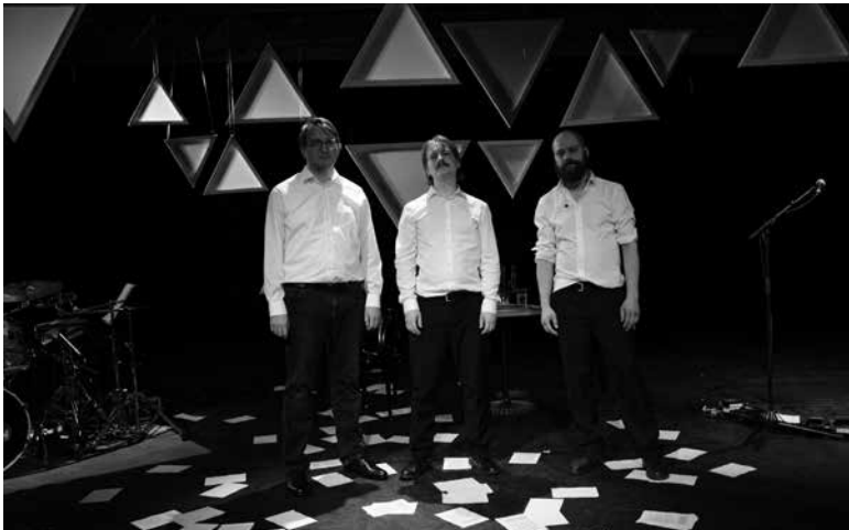
Projekt „Tat und Tod“