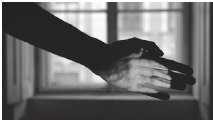
Alexandra Baumgartner, „Absence“, 2019, Ölfarbe auf Pigmentdruck, 110 x 80 cm

Mein Master-Thema war „Fotografie im Internet“ in Bezug auf Online-Bildarchive wie Google Streetview oder Webcams. Ich bin ohne digitale Medien aufgewachsen und war dann sehr gierig, als ich erstmals Zugang zum Computer bekam. Deshalb kenne ich beide Welten gut. Das Verhältnis digital – analog ist sehr komplex. Gerade die Fotografie ist von der Digitalisierung stark betroffen. Während des Kuratierens gab und gibt es ständig neue Hypes. Deswegen versuchen wir weniger, einen Überblick über die neuesten Entwicklungen zu geben bzw. einen „State of the Art“ zu formulieren, sondern werfen vielmehr einen Blick aus unserer Perspektive, aus der Perspektive der Fotoszene.