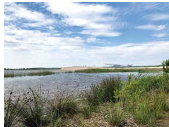
© Moritz Majce und Sandra Man

Moritz Majce und Sandra Man laden in ihrer neuesten Arbeit das Publikum ein, sich auf Raumdynamiken und Begegnungen einzulassen.