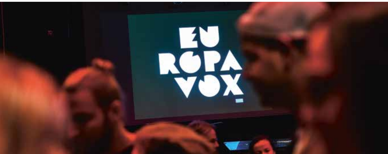
© Moritz Nägele und Sandra Min