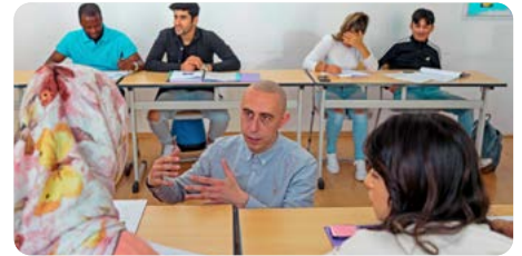
Teilnehmer_innen von WUK construct

Die Erweiterung der digitalen Kompetenzen nimmt bei WUK work.space einen besonderen Schwerpunkt ein. Digitalisierung bedeutet nicht nur, Zugang zu neuen Technologien zu haben, sondern ist auch unmittelbar mit den Möglichkeiten zur Teilhabe in einer digitalen Gesellschaft