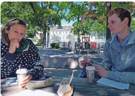
Über seine positiven Erfahrungen im Jugendcoaching von WUK faktor.c berichtete ein Jugendlicher im Interview. Nach seinem Entschluss, eine weiterführende Schule zu besuchen, wurden gemeinsam mögliche Schulen gesichtet, Anmeldeformalitäten bewältigt und konkrete Pläne gemacht.

Eine der ersten öffentlichkeitswirksamen Aktionen des NEBA-Betriebsservice, das im Mai 2021 seitens des Sozialministeriums ins Leben gerufen wurde, war eine Ö3-Aktion. Junge Menschen, die in den Arbeitsassistenten begleitet werden, wurden zu ihrer Traumausbildung interviewt, um Unternehmen dazu zu motivieren, Lehrstellen anzubieten. Insgesamt konnte dadurch die Möglichkeit für 142 Lehrstellen eröffnet werden. Mit den Betrieben, die daran interessiert waren, wurde umgehend durch das Betriebsservice Kontakt aufgenommen.