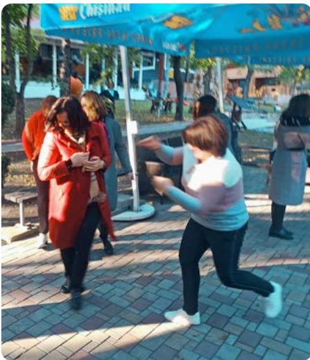
Ein Workshop zum Thema „Die praktische Umsetzung von Inklusion, Vernetzungsarbeit und inklusiver Beratung“ in Moldau