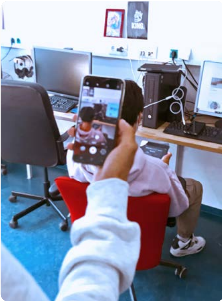
Ein Instrument für die digitale Teilhabe ist eine Serie von How-To-Videos, die den Jugendlichen Fragen zum digitalen Bewerbungsprozess beantworten sollen.