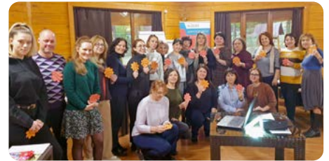
Teilnehmer_innen eines Workshops von WUK Mitarbeiter_innen in Moldau

Auf Grundlage einer Online-Befragung der WUK-Mitarbeitenden zu den psychischen Belastungsfaktoren und nachfolgenden Gruppeninterviews, in denen Verbesserungsvorschläge erarbeitet wurden, wurde 2021 ein Endbericht verfasst. Eine Steuergruppe leitete Maßnahmen ab, die 2023 einer Wirksamkeitsprüfung unterzogen werden. Ein Blick auf die Maßnahmenliste zeigt: Wir sind gut unterwegs! Beispielsweise wurden eine Home-Office-Regelung erarbeitet und diese in Anwendung gebracht sowie die Personalressourcen in den Abteilungen EDV und Finanz- und Rechnungswesen an den gestiegenen Bedarf angepasst.