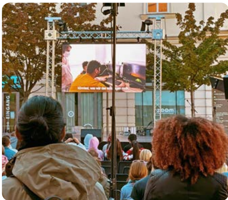
Präsentation der Abschlussprojekte von „Zukunft. Träumen“ des Vereins Occupy Culture im Museumsquartier.

In den verschiedenen Bildungs- und Beschäftigungseinrichtungen des WUK haben 2021 insgesamt 316 Personen (119 w / 195 m / 2 d) ihre Teilnahme erfolgreich beendet.