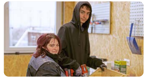
Teilnehmer_innen von WUK Get Up - Stand Up bei der Arbeit