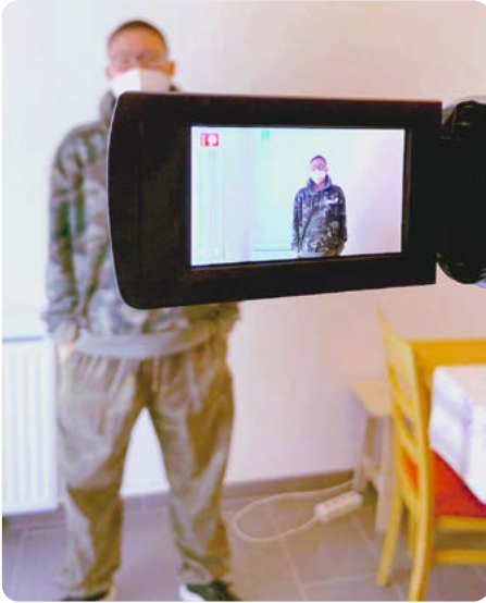
Digitale Teilhabe bei WUK work.space im Rahmen des Projekts >Enter<

Eineinhalb Jahre Pandemie hat vieles in unserer Arbeitswelt auf den Kopf gestellt. Digitalisierung und Home-Office haben den Blick auf unsere Büros und auf die Ressource Raum maßgeblich verändert. Da wir bei diesen Entwicklungen nicht nur Zuschauer_innen sein, sondern sie aktiv mitgestalten wollen, hat der Strategiekreis 2021 ein neues Strategisches Handlungsfeld mit dem Namen „Büro der Zukunft“ definiert.