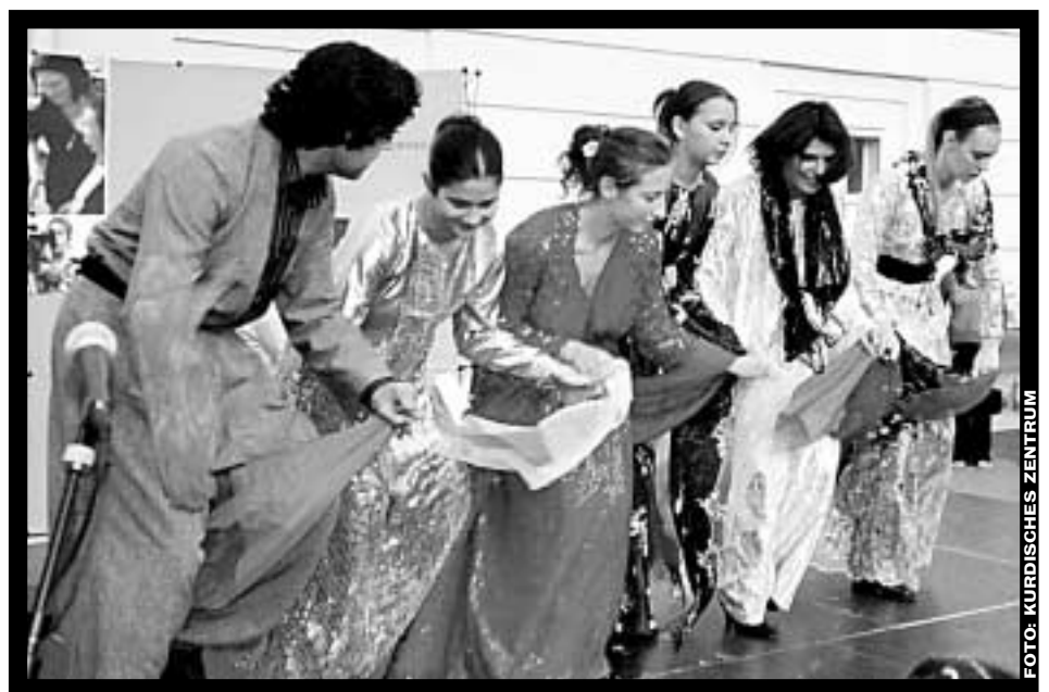
Tanzgruppe Alwan des Kurdischen Zentrums

Es ist also nicht weiter verwunderlich, dass das Kurdische Zentrum, so wie die meisten KurdInnen, proamerikanisch eingestellt ist und die USA als die Befreier des