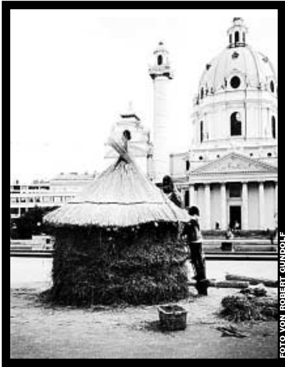
Bau der Lehmhütte am Karlsplatz