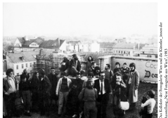
Das Kollektiv der Fotogalerie Wien und die Künstler_innen der Ausstellung „Neue Fotografie am Werk“ 1983

Die Bildstrecke in dieser Ausgabe ist eine Auswahl aus 40 Plakatmotiven der Jubiläumsausstellung. www.fotogaleriewien.at