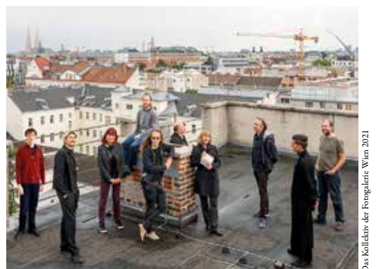
Das Kollektiv der Fotogalerie Wien 2021