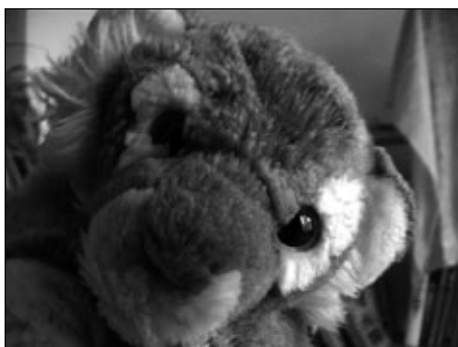
Tiger Therapie“ SI.SI. Klocker, (work in progress 2013)