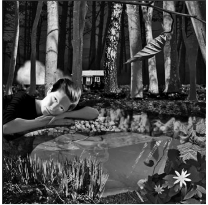
Ingrid Sandsborg in der Fotogalerie Wien: 2013, By a pond in the woods, Digital Collage/Acryl Print, auf Alu

gangenheit, das die Phantasie beflügelt – eine Auseinandersetzung mit einer Welt zwischen Fiktion und Realität.