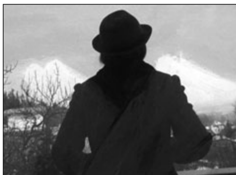
„Von den Himmeln“ SI.SI. Klocker, (work in progress 2013)