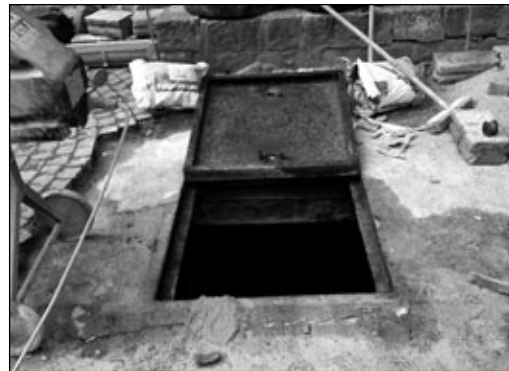
Der im Hof entdeckte Keller

Im Kellergeschoß Stiege 3 (Veranstaltungsbereich) und Projektraum wurden die WC-Anlagen für das Publikum und den Werkstätten-Bereich neu errichtet. Dafür waren der Komplettabbruch aller bestehenden Zwischenwände und Sanitäreinrichtungen sowie die Entfernung der alten Ver- und Entsorgungsleitungen erforderlich. Im Kellergeschoß wurde für die Frauen ein großer Raum mit sechs Sanitärzellen geschaffen, für die Männer ein Raum mit zwei Sanitär-