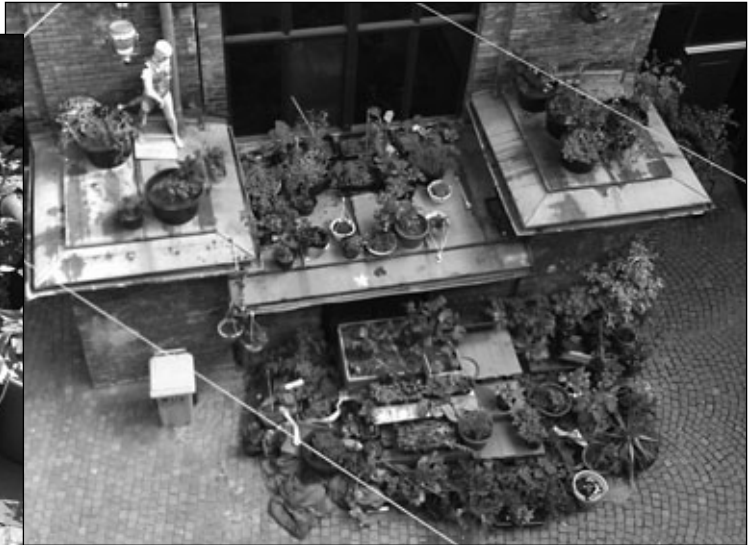
Urban Gardening im WUK

Mit einem ambitionierten Zeitplan starteten wir Mitte Juli 2013 die heurige Sommerbaustelle. Als Fertigstellungstermin war die letzte Augustwoche vorgesehen. In knappen sechs Wochen sollten im Außenbereich der hintere Hofbereich neu gepflastert und auf Stiege 3 die Publikums-WC-Anlagen erneuert werden.