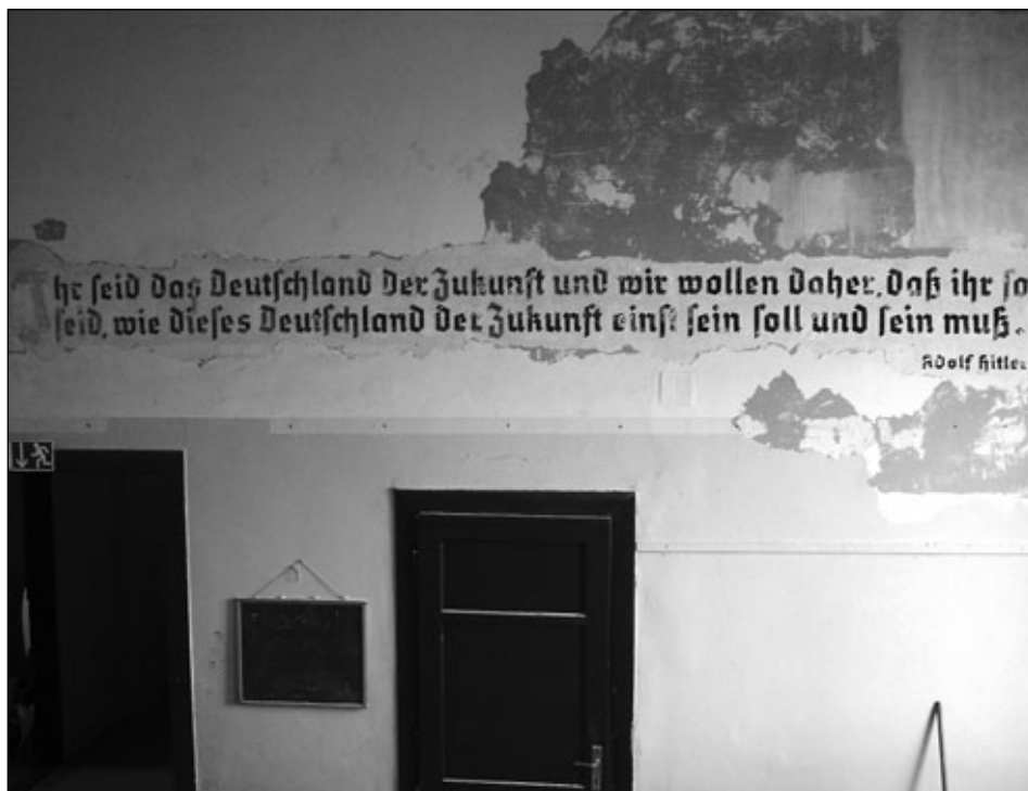
Freigelegte Spuren einer schrecklichen Vergangenheit, gefunden in der SchülerInnen Schule

delte sich um ein ziemlich teures Konzert - meine Mitgliederermäßigung geltend machen, na ja, da bin ich dann kläglich gescheitert. Ich klickte auf „Häufige Fragen und Antworten“, von dort weiter auf: „Ich bin WUK-Mitglied. Wie komme ich zu meinem ermäßigten Ticket.“ Es erschien: „Antwort: