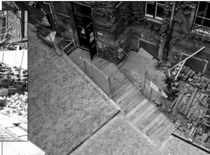
Die Baustelle am 2. September

zellen und sieben Urinalen. Darüber hinaus wurden ein Personalraum mit Waschgelegenheit, Dusche und WC für das Putzteam geschaffen, sowie eine Lagerfläche für diverse Arbeitsutensilien und Papiervorräte. Im Projektraum im ersten Stock entstanden eine barrierefreie Toilette mit Duschköglichkeit, je ein separates Frauen- und Männer-WC sowie ein WC mit Arbeitswaschbecken für die WSB-Ateliers.