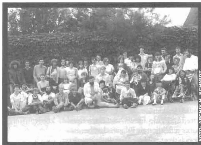
AKN-Ferienlager 1982 in Wieselburg, NÖ