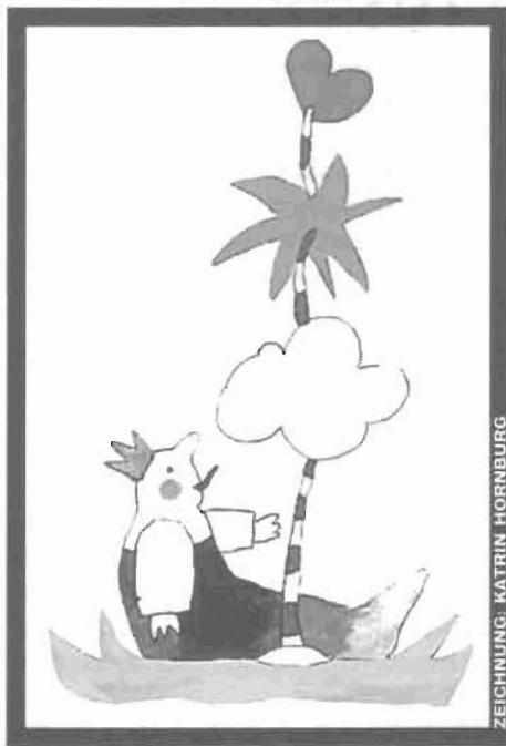
ZEICHNUNG: KATRIN HORNBURG

monatlich treffen, und entwickelte innerhalb dieser Gruppe eine Vereinigung für junge IllustratorInnen, die ihren Katalog sowie ihre Werke bereits im WUK im Projektraum präsentierten und mittlerweile auch ein eigene Homepage ( www.13strich.at ) besitzen. Die Präsentations-